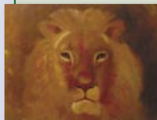
Obra: O LEÃO Autor: Mario Kykuta Dimensão: 60 x 80 cm