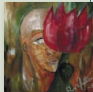
Obra: FLOR DE GAIA Autor: Rafael Mateus Dimensão: 50 x 50 cm