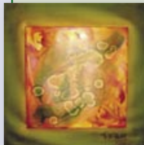
Obra: METAMORFOSE Autora: Hosana Dimensão: 60 x 60 cm

Confira algumas obras que estão sendo produzidas na Oficina de Arte da ABE: