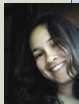
Escrito por Cristiane Maciel, assistente social da ABE

http://www.epilepsiabrasil.org.br/ http://www.machadodeassis.unesp.br/